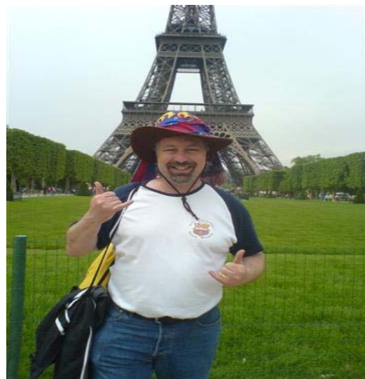
Socio de la Penya de Berna en la final de París