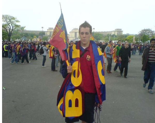
Socio de la Penya de Berna en la final de la Champions de París