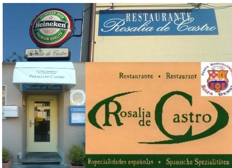
El local de la Penya Barcelonista de Berna

Punto de encuentro: en el local, cada vez que juega el Barça