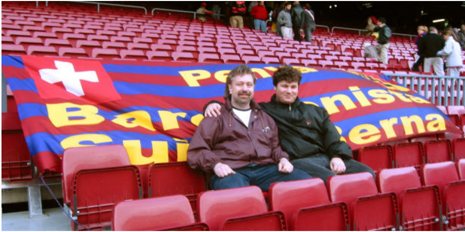
El viejo y el nuevo presidente de la Penya Barcelonista Suiza Berna juntos en el Nou Camp